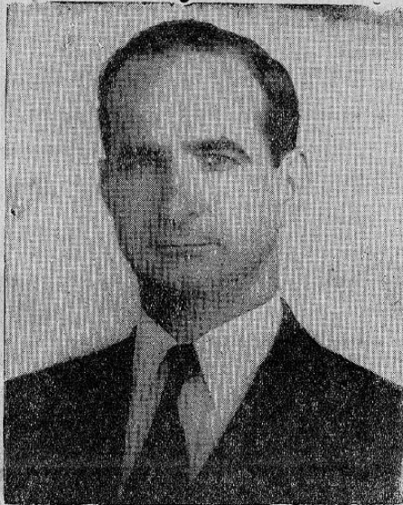
DON JOSE FIGUERES F. Presidente de la Junta de Gobierno

Y DE NO HABER SIDO POR LA LEALTAD, HONRERIA DE BIEN Y ALTO SENTIDO PATRIOTICO DE D. OTILIO ULATE, ESA ASONADA PUDO HABERSE CONVERTIDO EN UNA CRUENTA GUERRA CIVIL